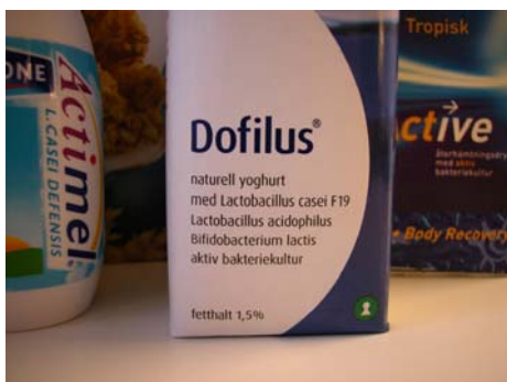
Tabell 2. Några representativa kommersiella probiotiska arter.

mikrobiellt tillskott, som positivt påverkar värddjuret genom att förbättra dess mikrobiella balans i tarmen". [7]