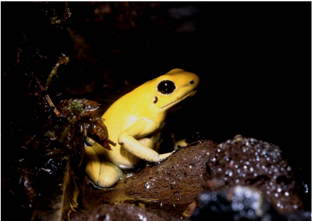
Pilgiftsgroda, Phyllobates terribilis

När de ordnar med sina pilar, är lokalbefolkningen särskilt försiktiga att inte nudda vid grodan.