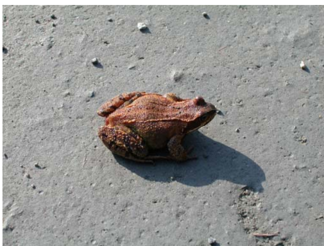
Padda, Bufo bufo

Var tog då kyssen vägen i de sagor om grodan som vi har idag? Säkert är det så att det sedlighetsbevakande samhället under perioden efter Grimms saga knappast kunde förväntas godkänna förvaring av unga män, vare sig de var kungliga eller inte, i unga flickors sängar. Därför var det säkert klokast att flytta hela historien från sovrummet och ut på vägen – inget prasslande – även om en systerlig kyss möjligen kunde behövas för att få trolleriet att fungera.