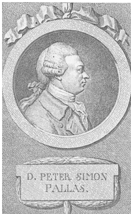
Figur 1. Peter Pallas