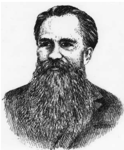
Figur 5. Alexander Kovalevsky.

Stora framsteg gjordes både i slutet av 1800-talet och på 1900-talet i mikroskopisk undersökningsmetodik och alltfler detaljer avslöjades om lansettfiskens fosterutveckling och organisation. Den ryske biologen Kovalevsky, som vistades i Neapel och Messina för att undersöka tidig embryonalutveckling hos havsdjur, upptäckte stor överensstämmelse mellan utvecklingen av befruktade ägg av lansettfisk och hos sjöpungr, ryggradslösa fastsittande djur. Senare visade det sig att sjöpungr är ett slags starkt modifierade primitiva ryggradsdjur. Lansettfiskens njurar är ytligt sett anmärkningsvärt lika exkretionsorgan hos vissa havsmaskar och mollusker, men elektronmikroskopiska studier visar att de i grunden ännu mer överensstämmer med ryggradsdjurens njurar. Ju mer man fick veta om lansettfiskens finstruktur, desto tydligare framträdde djurets karaktär av ryggradsdjur. Det kunde omöjligt uppfattas som ett övergångsstadium till ryggradslösa djur. Intresset för dess betydelse i evolutionsforskningen avtog. Vissa biologer betraktade Branchiostoma eller Amphioxus som en ryktbar kuriositet, en degenererad primitiv fisk som i samband med bottenliv reducerat sinnesorgan. Man var inte längre säker på att den var genuint primitiv.