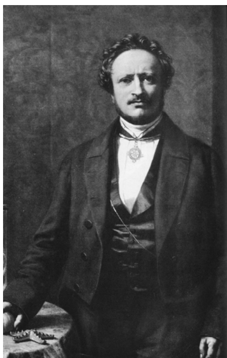
Figur 4. Dr. Johannes Müller.

Retzius skickade i ett brev till Johannes Müller i Berlin resultat av sina preliminära anatomiska observationer, och denne lät omedelbart publicera brevet. Retzius bad vidare sin tyske kollega Rathke att vid hemresan till Tyskland medföra konserverade lansettfiskar adresserade till Müller, och han inviterade i ett brev Müller att komma till Kristineberg i Bohuslän sommaren 1841, så att de gemensamt kunde undersöka lansettfisk från Väderöarna. Müller var mest känd som fysiolog, men omkring 1840 hade han alltmer börjat ägna sig åt jämförande anatomi och lansettfisken upptog hans tankar i hög grad sedan han fått se djuret i London. Han accepterade Retzius förslag och reste i augusti 1841 över Stralsund och Greifswald till Sverige. Efter besök i universitetsstaden Lund fortsattes resan med häst och vagn över Helsingborg och Halmstad till Göteborg, och sedan vidare till Fiskebäckskil och Kristineberg i Bohuslän. Resan har livfullt skildrats i bevarade brev till hustrun. Forskarna hyrde in sig hos en sjökapten i Kristineberg och arbetade tillsammans i två veckor. Ett par män ur lokalbefolkningen som av Sven Lovén tränats att samla marina bottendjur sändes till Väderöarna med uppdraget att inte återkomma utan levande "lansetta-