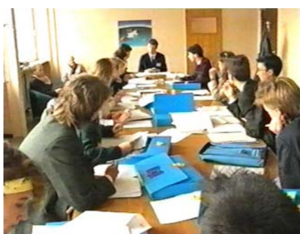
Bild 2. Kommittémöte