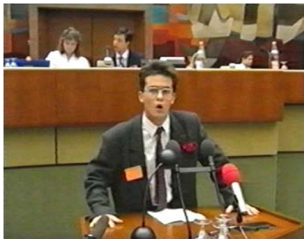
Bild 3. Andra plenarmötet

4. Bestäm vilken intressegrupp som varje elevgrupp skall föreställa – låt dem inte själva välja (se ovan)! Mitt råd är att inte fördela eleverna så att du har en blandning av aktiva och passiva elever i varje grupp – om du vill fördela dem på något speciellt sätt, så bilda grupper av passiva respektive grupper av aktiva elever. (De passiva blir aktiva förvånande snabbt!). Ge de "passiva" grupperna roller som extremister och de "aktiva" som konservativa.