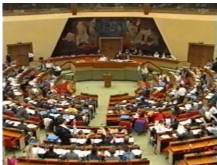
Bild 1. Inledande plenarmöte

presenterade. I vårt kloningsexempel har vi sex intressegrupper. Om klassen består av 30 elever, så skall man ha 5 elever i varje grupp.